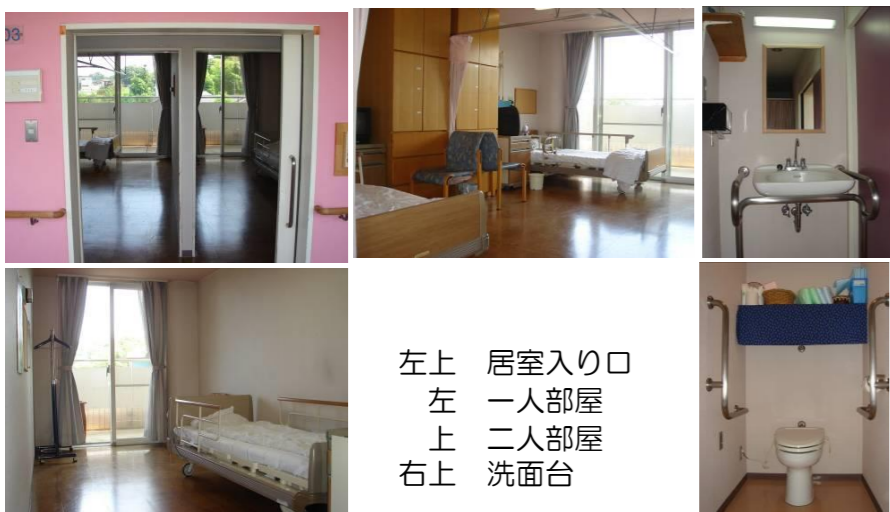
左上 居室入り口 左 一人部屋 上 二人部屋 右上 洗面台