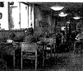
廊下の広い部分を居間に してグループケアを実施 (川崎市の金井原苑)

(注)特別養護老人ホームにはユニット形式になっていない個室などもあり、それぞれで費用は異なる。施設数などは2008年の厚労省調査より、月額費用は国が示した標準的金額、施設によってはこれ以上に部屋代などを徴収する場合や日常生活費などの費用を徴収することもある